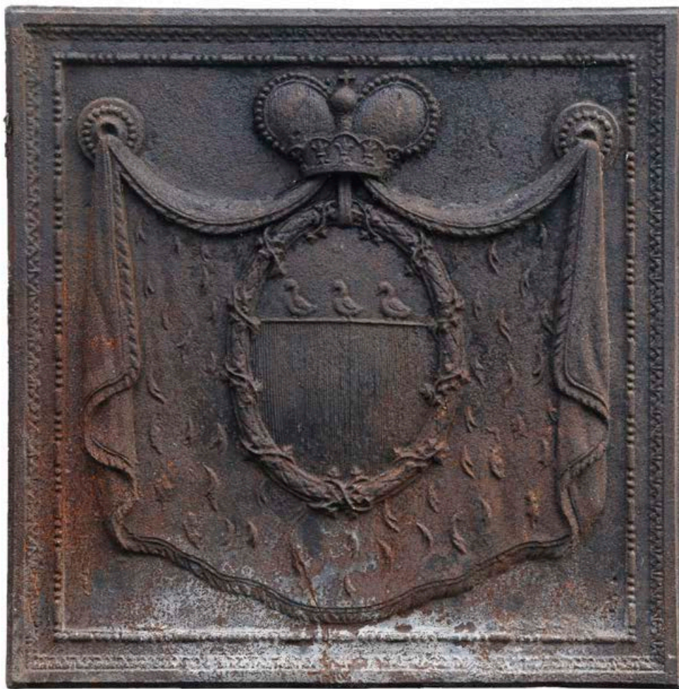
De haardplaat met het wapen van de familie d'Ursel (vóór conservatiebehandeling)