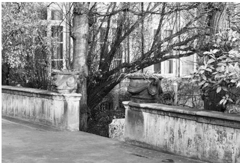
In 1943 stonden er twee terracotta potten op het terras van het hôtel d’Ursel en nog een derde onderaan de trap