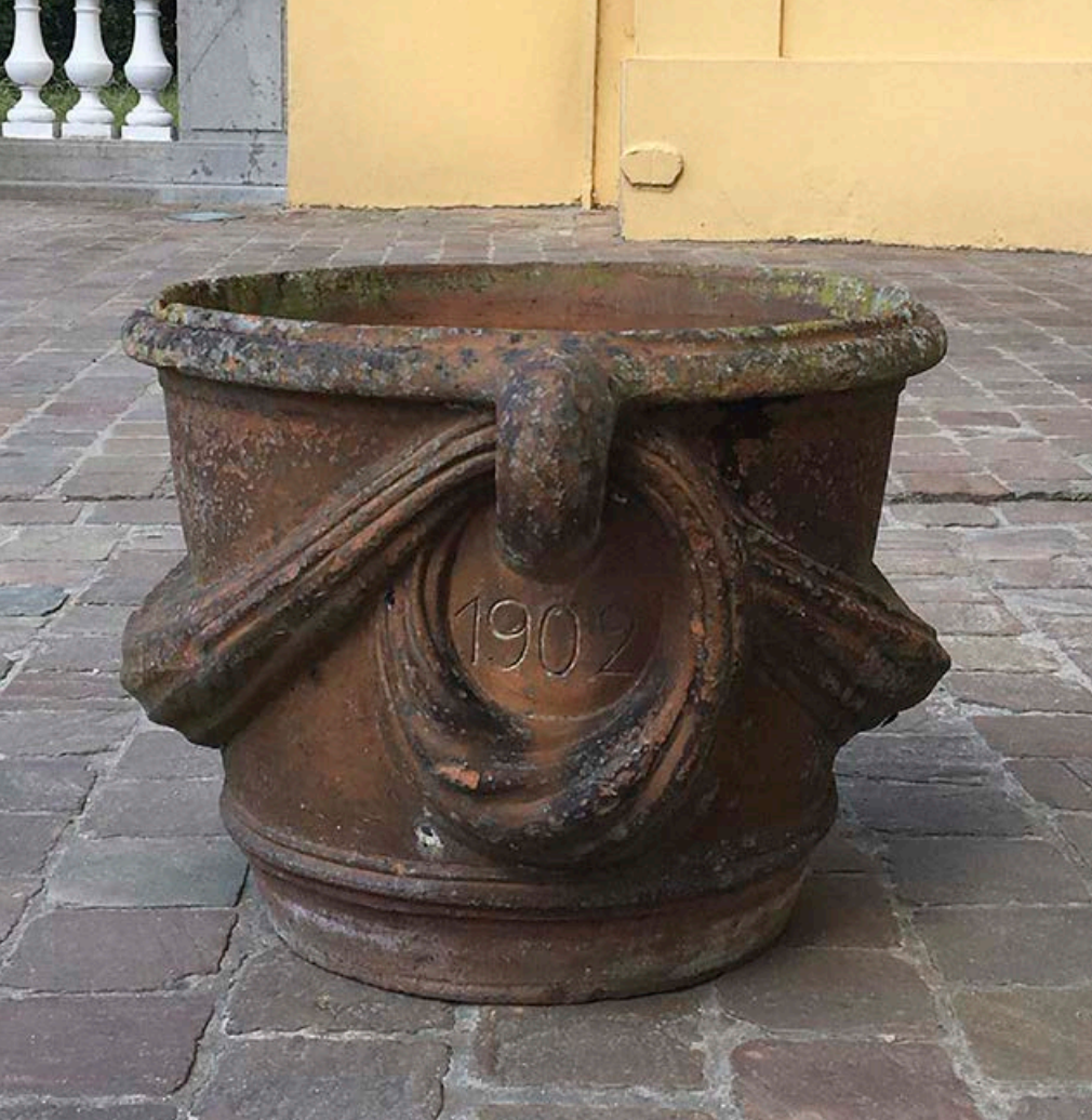
Het jaartal 1902 is met de hand ingekrast

‘Deze bloempot is geen industrieel product, maar werd geëstampeerd’, zegt Mario Baeck, een autoriteit op het vlak van keramiek. ‘De kleimassa werd in hompen in de vorm geduwd en geleidelijk aan tot een geheel opgebouwd. Daarna werd de binnenzijde met de hand afgestroken. Het is zeer verzorgd werk en duidelijk gemaakt in een atelier met goede oveninfrastructuur om zo’n relatief grote stukken te bakken. Op basis van de roodbakkende klei die veel ijzeroxide bevat, gaat het niet om een Duits of Engels product. Frans is perfect mogelijk, maar in de catalogi van een aantal belangrijke producenten vind ik dit model niet direct terug. Als de pot in België gemaakt is, dan zou hij afkomstig kunnen zijn uit meer gespecialiseerde ateliers in Tubeke (Léon Champagne) of Gent (Delanier Frères of Zens).’