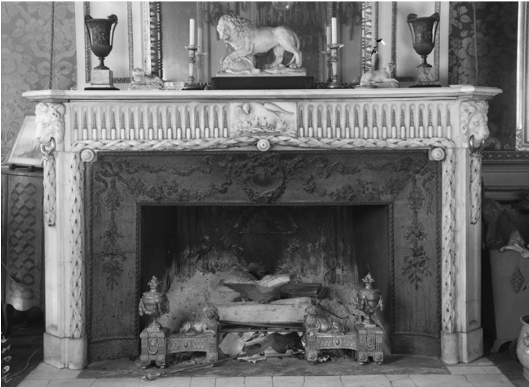
De schoorsteenmantel van de kleine salon in het hôtel d'Ursel