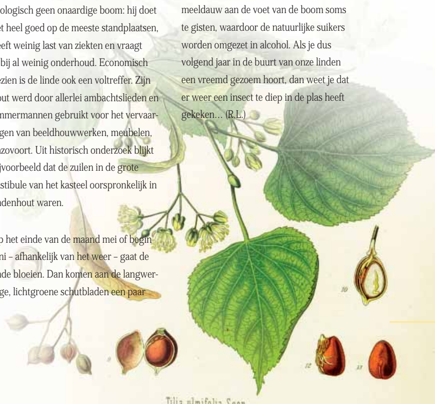
Tilia ulmifolia Scop.