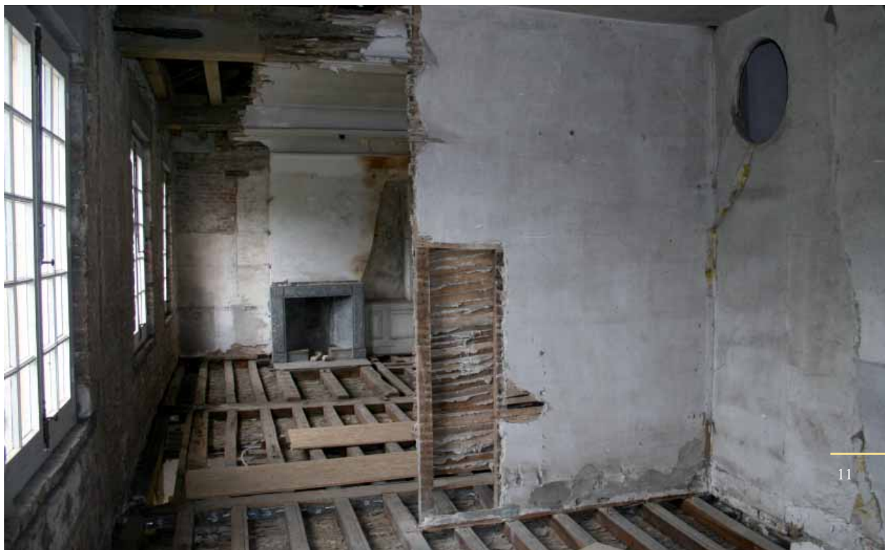
De uitgebroken vloer op de tweede verdieping

Op de eerste verdieping is de aannemer ondertussen gestart met de schilderwerken. Eerst werden alle ramen, deuren en lambriseringen voorbereid: de oude verflagen werden verwijderd en het hout werd met de hand opgeschuurd. Daarna hebben de schilders de kamers een voor een afgestoft en zetten ze overal de eerste laag grijze of witte verf. Vervolgens schuurden ze al het houtwerk een tweede keer en werden de kleine gaatjes en oneffenheden opgestopt. In de komende maanden krijgen de kamers nog een tweede en mogelijk derde laag. Daarna staat enkel nog de eindafwerking op het programma. Als alles goed gaat wordt de eerste verdieping geopend op de Open Monumentendag, zondag 9 september 2007. (R.B.)